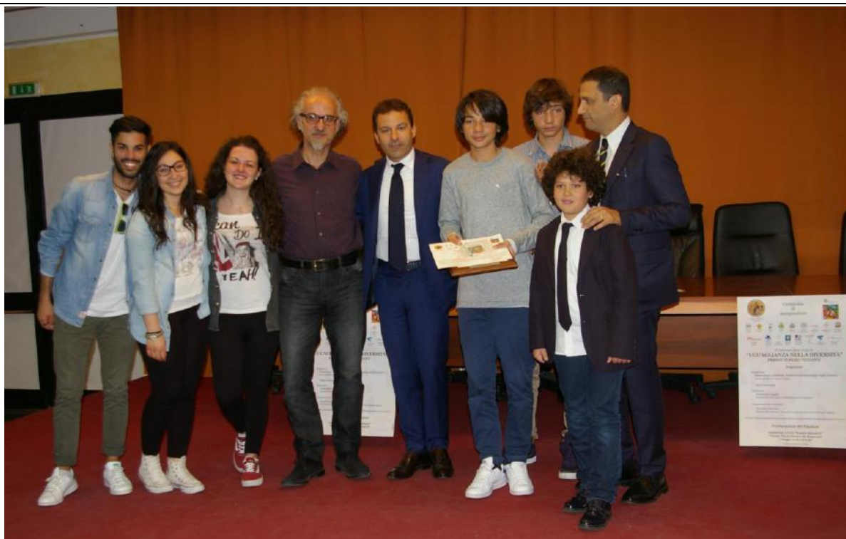
"UGUAGLIANZA NELLA DIVERSITÀ" Premio Tomaso Viglione Vincitori IX Edizione, 2016: classe IV e V AT del I.I.S.S. Gorjux -Vivante di Bari